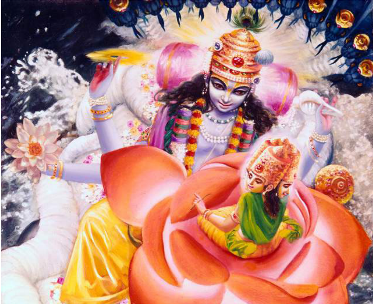
El Señor brahma ofreciendo plegarias al Señor Vishnu

Divinidad transcendental, puede ser sujeto a maya; como las jivas sufren del olvido de sus identidades reales y de las miserias de este mundo cuando Dios vive en ellos como inmanencia.