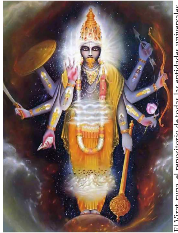
El Virat-rupa, el repositorio de todas las entidades universales