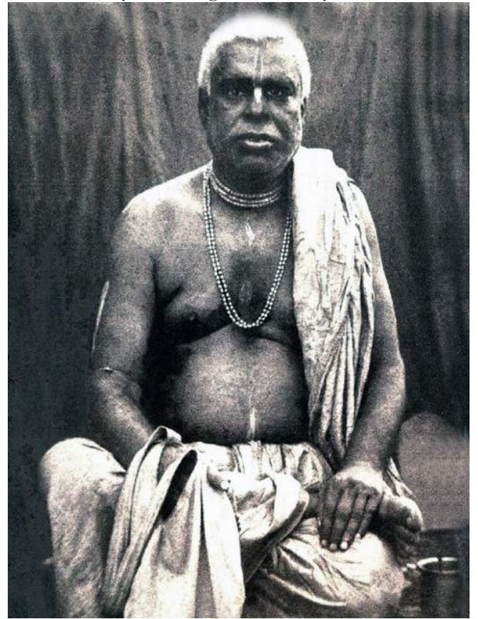
Srila Bhaktivinode Thakura

Goswami: Uno puede oír de Krishna de una persona materialista, o de un devoto. Estas dos formas de oír son diferentes en muchas maneras. Al oír de Krishna de una persona materialista, el oyente no atiende fe. Por otro lado, al oír sobre Krishna de un devoto entusiasmado por estar comprometido en servicio devocional, el oyente alcanza la piedad espiritual. En algún nacimiento futuro la fe espiritual despertará en él. Cuando alcanza esta fe, el alma se entusiasma por oír las glorias de Krishna solo de las bocas de grandes devotos.